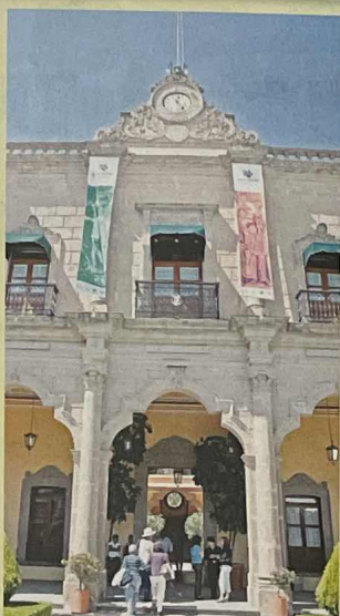
La Vista del Palacio Municipal de Huichapan que también quedaría incluido en el perímetro protegido.

ver programas educativos y de divulgación sobre la zona, particularmente para estimular el respeto por los monumentos de Huichapan.