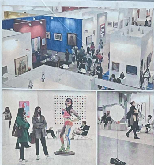
Para muchos galerías, la feria, en su regreso presencial, superó las expectativas de venta.